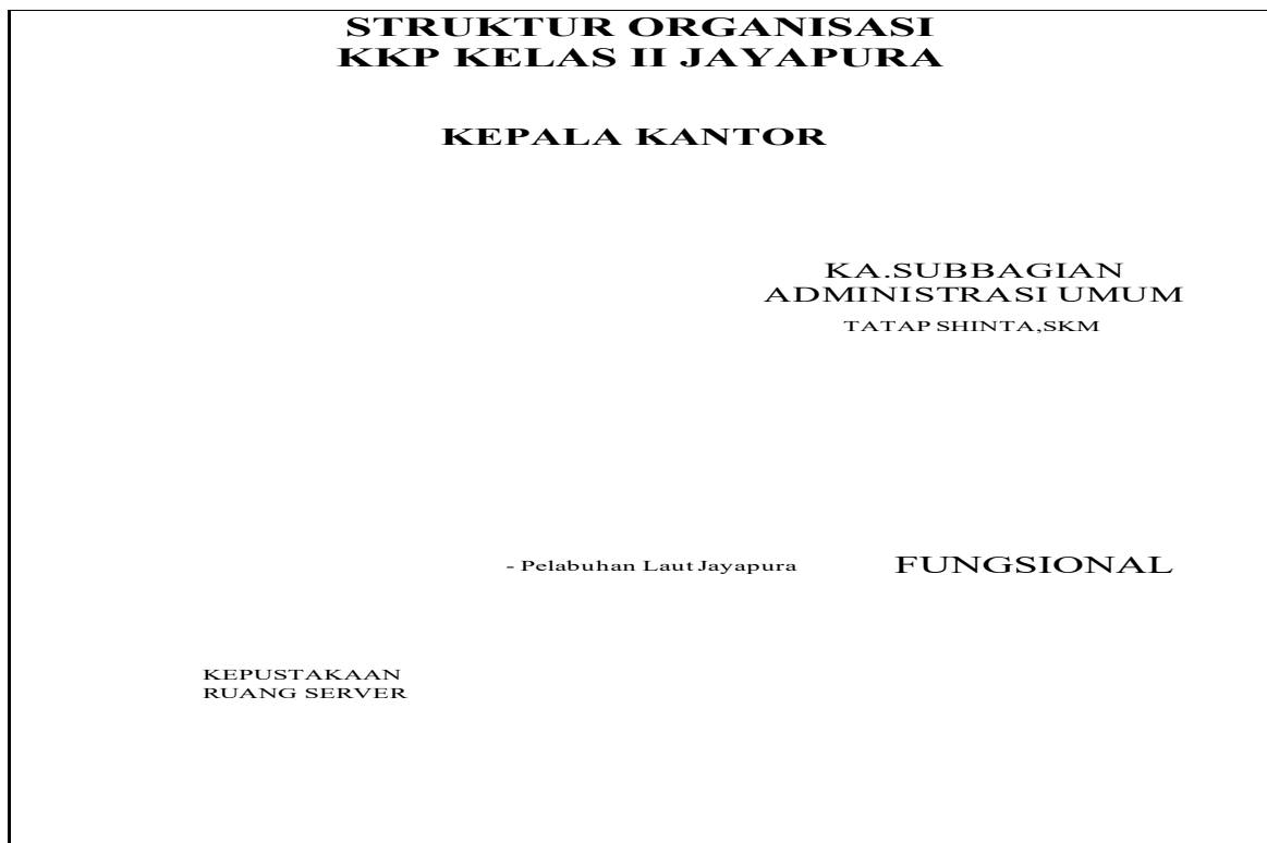
Gambar 2. Struktur Organisasi KKP Kelas II Jayapura Tahun 2022

Sesuai dengan Permenkes Nomor 33 Tahun 2021, tentang Organisasi dan Tata Kerja Kantor Kesehatan Pelabuhan, terjadi perubahan SOTK pada Kantor Kesehatan Pelabuhan. Kantor Kesehatan Pelabuhan mempunyai tugas pokok dan fungsi adalah melaksanakan upaya cegah tangkal keluar atau masuknya penyakit dan/atau faktor risiko kesehatan di wilayah kerja pelabuhan, bandar udara, dan pos lintas batas darat negara. Sesuai dengan SOTK yang terbaru pada Kantor Kesehatan Pelabuhan Kelas II Jayapura memiliki struktur organisasi seperti dibawah ini :